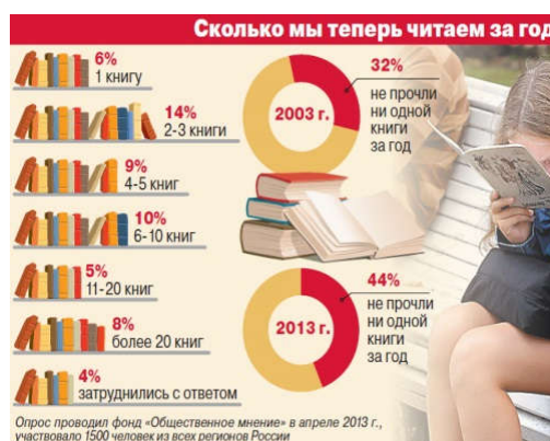
Рисунок №2. Инфографика.

Чтобы привлекать людей к чтению, российские издатели осваивают буктрейлеры и проводят яркие рекламные кампании